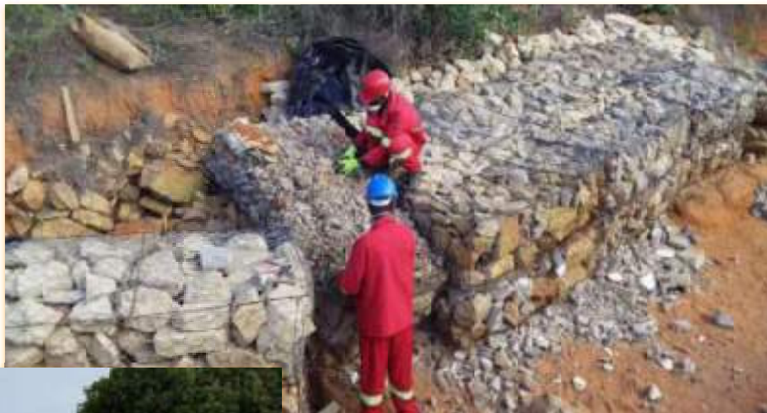
Reabilitação de Gabiões