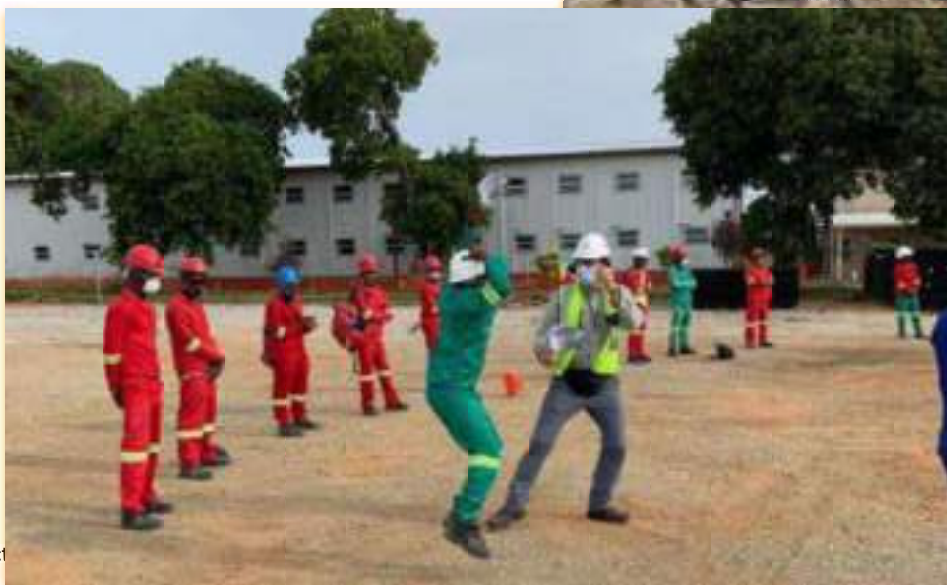
Treinamento de regra de ouro com distanciamento social